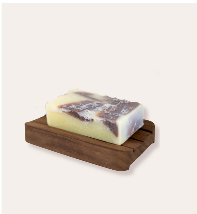
* Forêt mystique

Un parfum citronné, des inclusions de feuilles visibles et un rendu naturellement élégant. Savon frais, vivifiant, parfait pour les gammes été ou bien-être végétal.