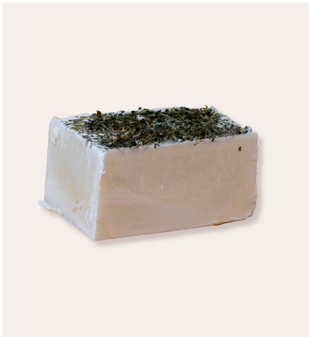
* Brise de verveine