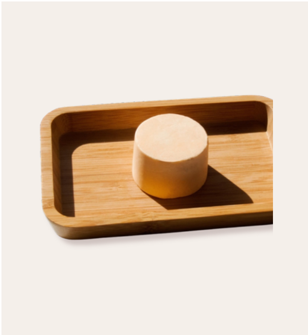
* Rituel d'ylang