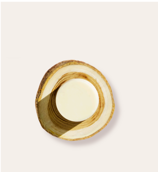
* Fleur de coton

Déodorant solide au parfum floral et solaire, aux notes exotiques. Signature olfactive affirmée, idéale pour des gammes bien-être ou rituels corporels du quotidien.